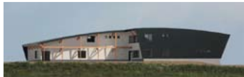
아바시리 시립 향토박물관 분관 모요로 패총관

우편번호093-0051 아바시리시 기타1조 히가시 2초메 TEL. 0152-43-2608