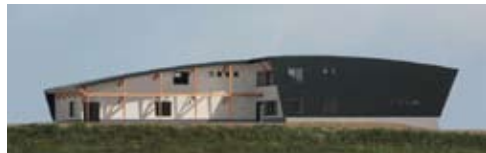
아바시리 시립 향토박물관 분관 모요로 패총관

우편번호093-0051 아바시리시 기타1조 히가시 2초메 TEL. 0152-43-2608