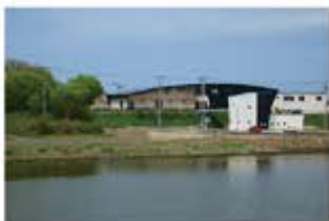
網走川対岸より遺跡をのぞむ