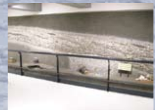
Воссозданный ракушечный курган

Прослеживаются обнаружение и этапы исследования ракушечного кургана Моёро