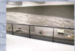
Воссозданный ракушечный курган

Прослеживаются обнаружение и этапы исследования ракушечного кургана Моёро