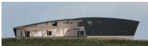
Муниципальный краеведческий музей г. Абасири Музей ракушечного кургана Моёро

093-0051 Абасири-си, Кита 1-дзё, Хигаси 2-тёмэ Тел.: 0152-43-2608