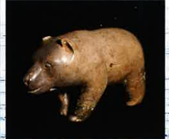
動物像(クマ) 湧別町川西遺跡出土 網走市立郷土博物館蔵 (展示資料は複製) 表の写真:湧別町教育委員会蔵(複製)