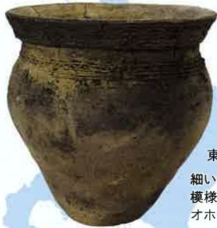
オホーツク土器 トコロチャシ跡遺跡出土 東京大学常呂実習施設蔵 細い粘土紐を貼り付けた模様をもつ、オホーツク文化後期の土器。

東京大学大学院人文社会系研究科は、北海道北見市(旧常呂町)に設置した北海文化研究常呂実習施設を中心に、オホーツク文化の遺跡を多数発掘調査してきました。本展示では、本州では初公開となる資料を含む最新の研究成果に基づいて、本州の古代文化とは大きく異なる、オホーツク文化の姿を描き出します。