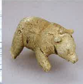
動物像(クマ) トコロチャシ跡遺跡出土 東京大学常呂実習施設蔵