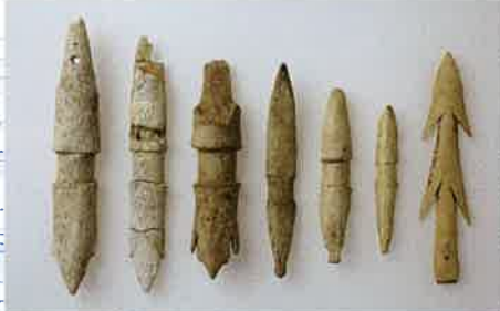
銚頭 トコロチャシ跡・栄浦第二遺跡出土 東京大学常呂実習施設蔵 海獣などの狩猟につかわれた、骨角製の銚の先端部。