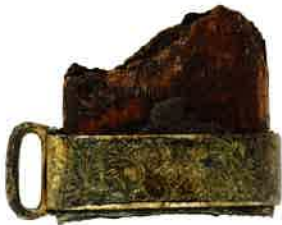
金銅装直刀(足金具) 目梨泊遺跡出土 枝幸町教育委員会蔵 刀装具を金で覆い、緻密な文様を彫った豪華な刀。

地図は国土地理院地図( https://maps.gsi.go.jp/ )を加工して作成